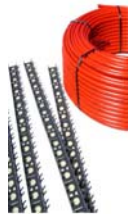
Naturetherm leidingen systeem

6. Eventueel af te werken met de Galtane kalkverf of Galtane EOS II afwasbare muurverf.